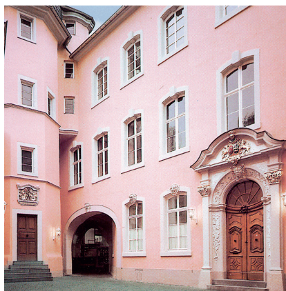
Das Palais Pillishof - Firmensitz